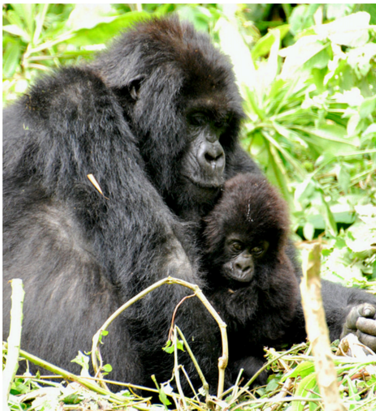
gorilles des montagnes

L'Fossey est reconnue comme la principale chercheuse mondiale sur le comportement des gorilles de montagne. Elle dit d'eux qu'ils sont « dignes, très sociables, doux, avec des personnalités individuelles, et des relations familiales fortes. »