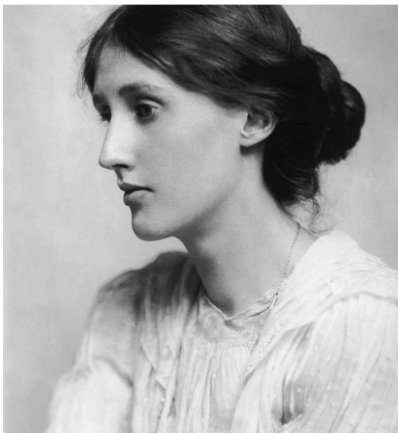
George Charles Beresford - Virginia Woolf in 1902

Tourmentée par la mort de ses parents, violée par son demi-frère, elle s'est toujours montrée fragile psychologiquement. Elle est morte noyée dans l'Ouse le 28 mars 1941, au Royaume-Uni en se suicidant