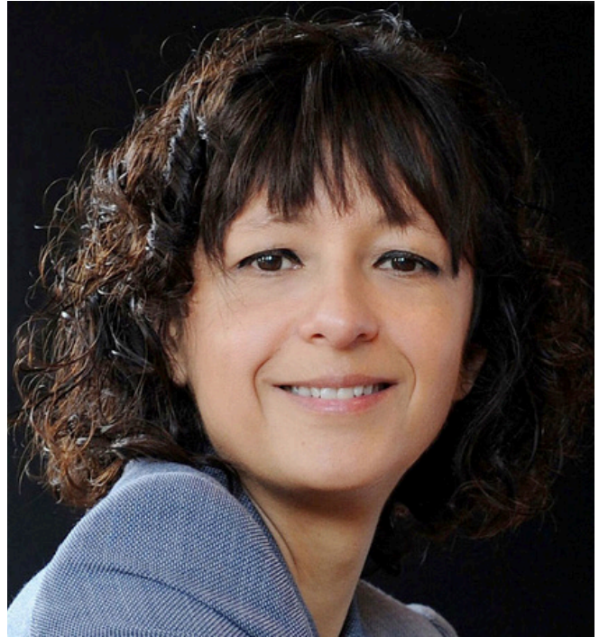
Emmanuelle Charpentier

Elle a eu la légion d'honneur en tant que commandeur en 2020 par François Hollande mais surtout elle obtient le prix Nobel de chimie en 2020. Durant sa carrière, donc de 2009 à 2020, elle a gagné 35 prix d'honneur et 8 autres distinctions.