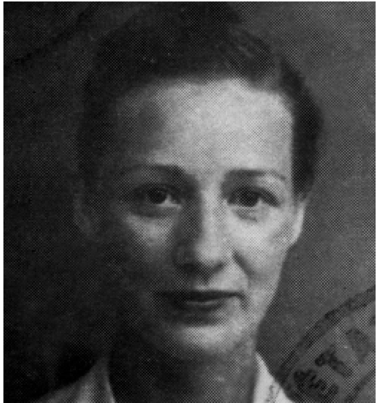
Marie-Madeleine Fourcade (photographie d'une fausse carte identité utilisée durant ses opérations de résistance ).

*Alliance est un réseau de renseignement de la résistance inférieure française pendant la Seconde Guerre mondiale.