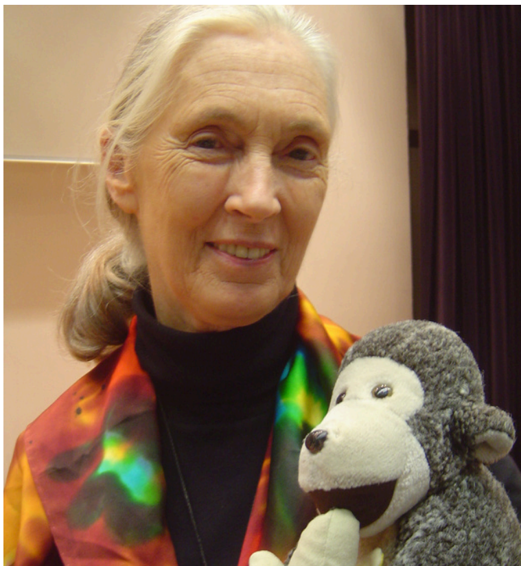
l'image de Jane Goodall

Jane a créé un petit rituel avec les chimpanzés « le banana club » : tous les matins aux mêmes heures, elle donne une banane à chaque chimpanzé pour créer un lien de confiance avec eux.