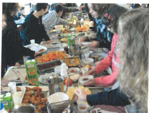
Organisation d'un petit-déjeuner pour les 6e»

Elle assure des entretiens individuels, la prévention par les visites médicales des élèves de 6e, organise le programme de prévention par des actions sur le thème de la santé.