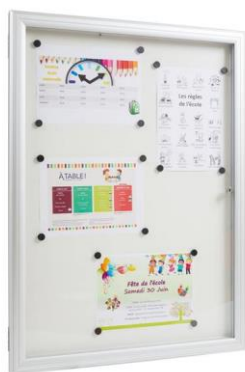
Panneau d'affichage sous le préau