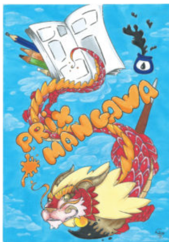
Dessins lauréats en 2018 et 2019