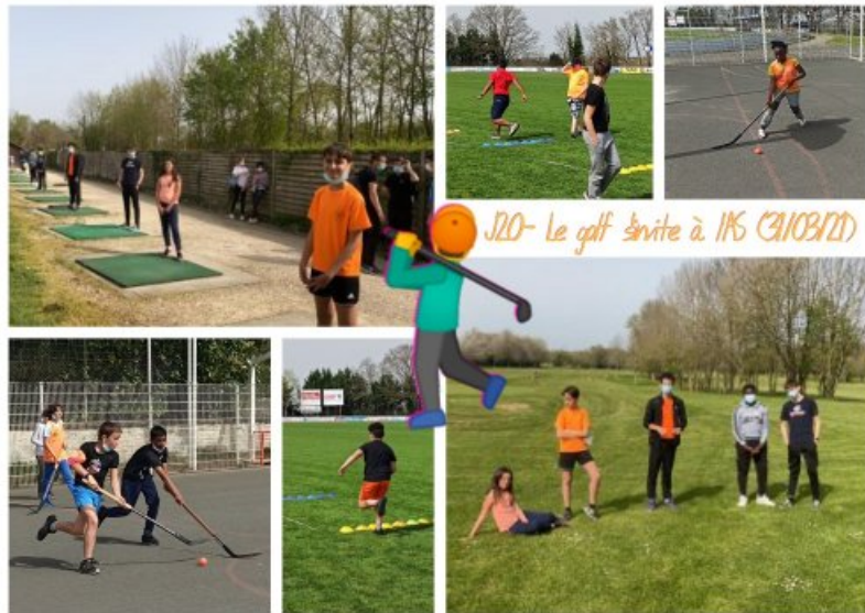
j20_montage (PDF de 684.6 ko)

10 licenciés de l'AS Curie se sont rendus au golf de Niort pour une après-midi d'initiation des plus réjouissantes. Parallèlement 27 autres ont profité des forts rayons du soleil pour pratiquer de la CO, du Hockey et/ou de l'Athlétisme. NIORT-TOKYO : 3421 km, nous sommes entre NOVGOROD, RUSSIE et KAZAN, RUSSIE