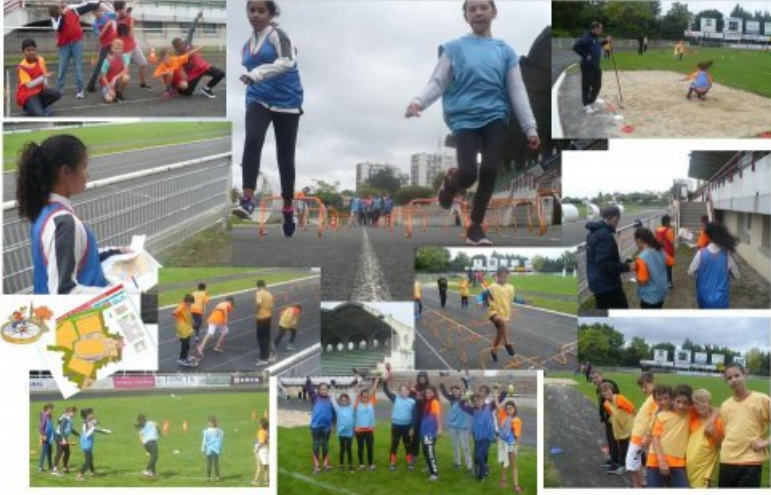
J2—EXTERIEUR : sports-co en échauffement puis ATHLETISME (sauter-courir-lancer) et COURSE D'ORIENTATION 22 participants (13/09/17)