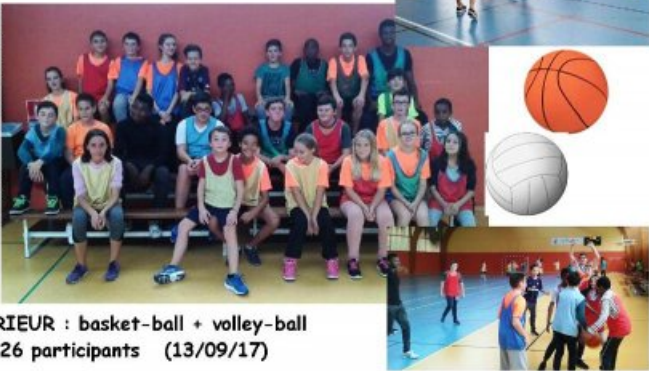
J2—INTERIEUR : basket-ball + volley-ball 26 participants (13/09/17)

Après un tournoi en 2e2 épreme disputé de Volley-ball où finalement les pros sont restés invaincus. Les 26 élèves présents au gymnase se sont reconcentrés sur un tournoi de Basket non moins acharnés. Nous souhaitons vous retrouver encore plus nombreux la semaine prochaine pour le début des rencontres entre collèges. S.M.MORZADRE