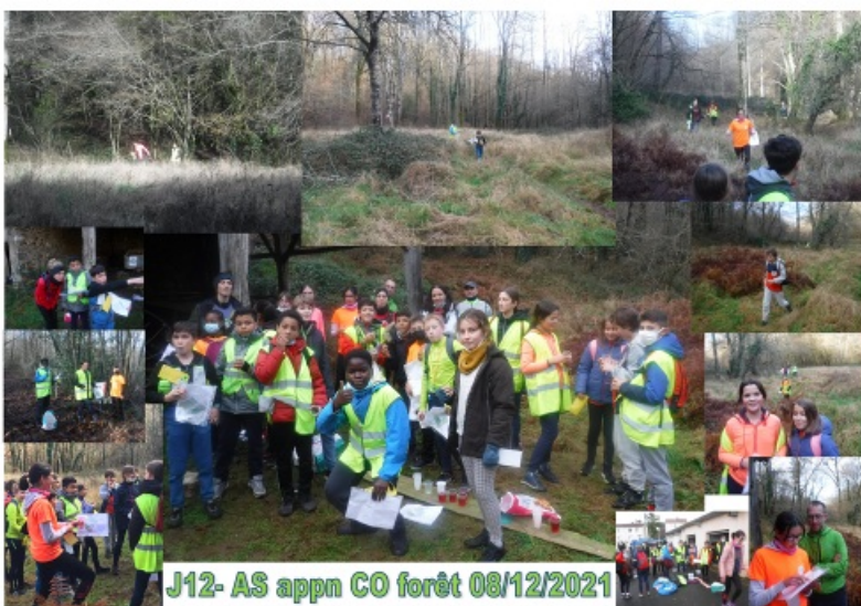
J12- AS appn CO forêt 08/12/2021

UN GRAND MERCI AUX PARENTS ACCOMPAGNATEURS et aux cuisiniers !