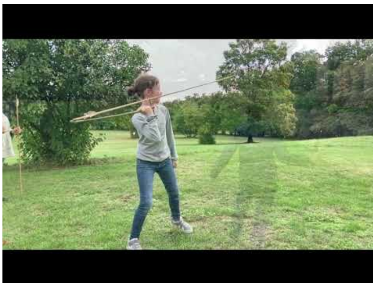
Tir au propulseur ( Video Youtube )

Ensuite, nous avons suivi la rotation des groupes pour, de nouveau, visiter le site de la Laugerie Basse pour les 6A et 6B cette fois-ci et nous avons poursuivi la fabrication de "canne à pêche" préhistorique, de "rhombe" et lancé des sagaies avec plus ou moins de succès ! Heureusement d'ailleurs que l'accès au repas n'était pas conditionné à la réussite ou non du tir avec un propulseur sinon, très peu de nos "jeunes Cro Magnons" auraient mangé à leur faim ce midi !