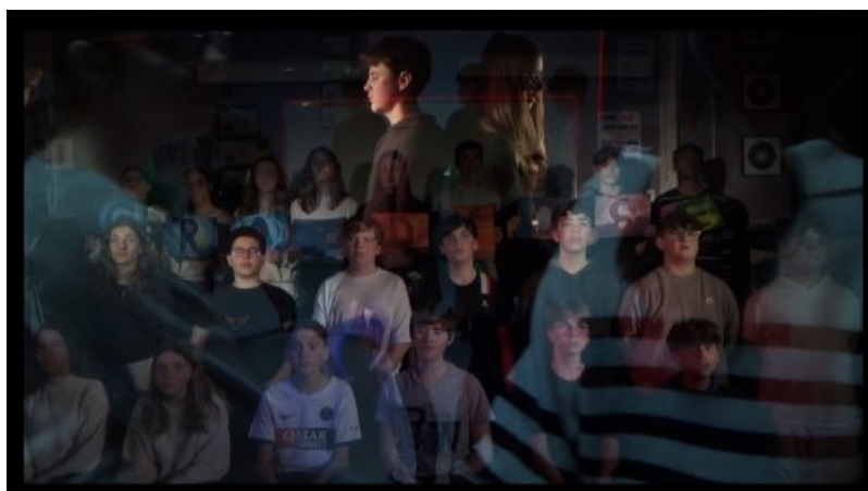
Un extrait du montage