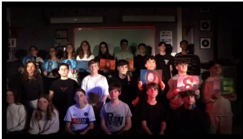
Les élèves avec les panneaux "grandis" & "ose"

Les vidéos ont ensuite été envoyées aux Francofolies et un montage final regroupant toutes les participations a été réalisé. C'est un total de 846 élèves réunis autour d'un même projet. Le clip final est sorti le 20 mars lors de la Journée de la Francophonie.