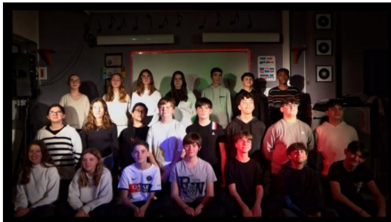
Prise de vue d'ensemble