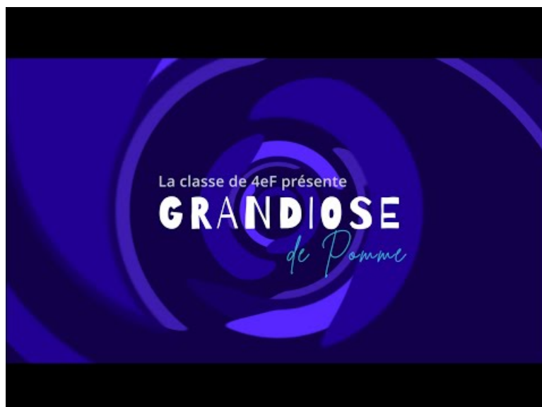
Chœur Virtuel des Francofolies de La Rochelle par les 4eF - version d'ensemble - mars 2024 (Video Youtube)