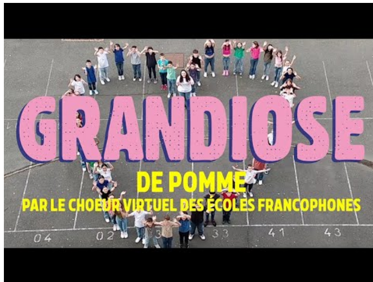
Le chœur des Francofolies 2024 chante "GRANDIOSE" de Pomme (Video Youtube)