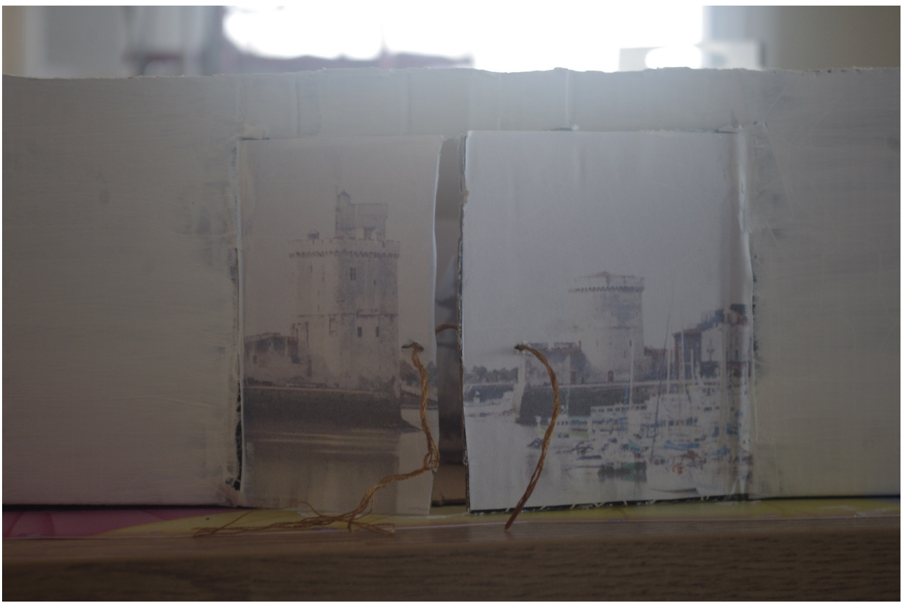
L'entrée dans le port de la Rochelle entre la tour de la Chaîne et Saint-Nicolas