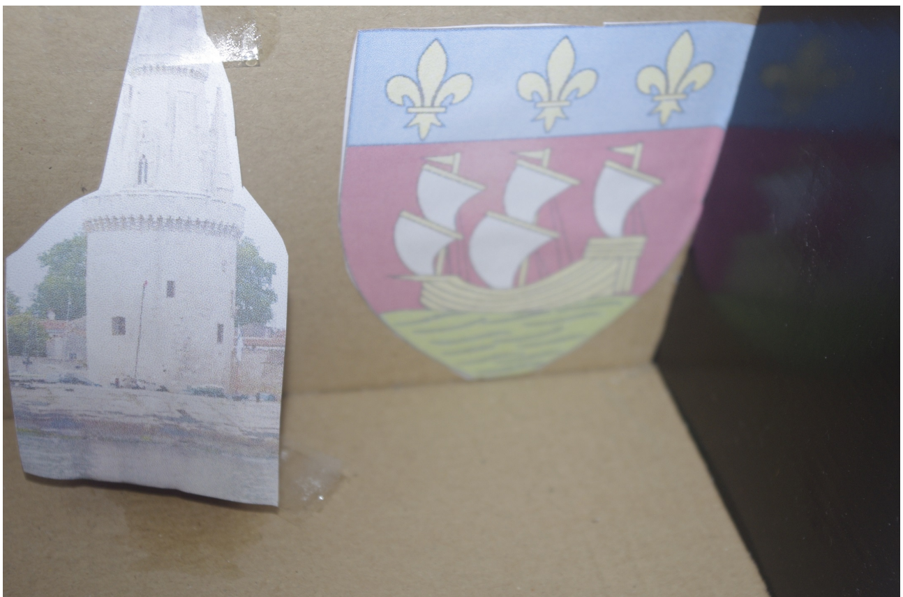
La tour de la lanterne et le blason de la Rochelle