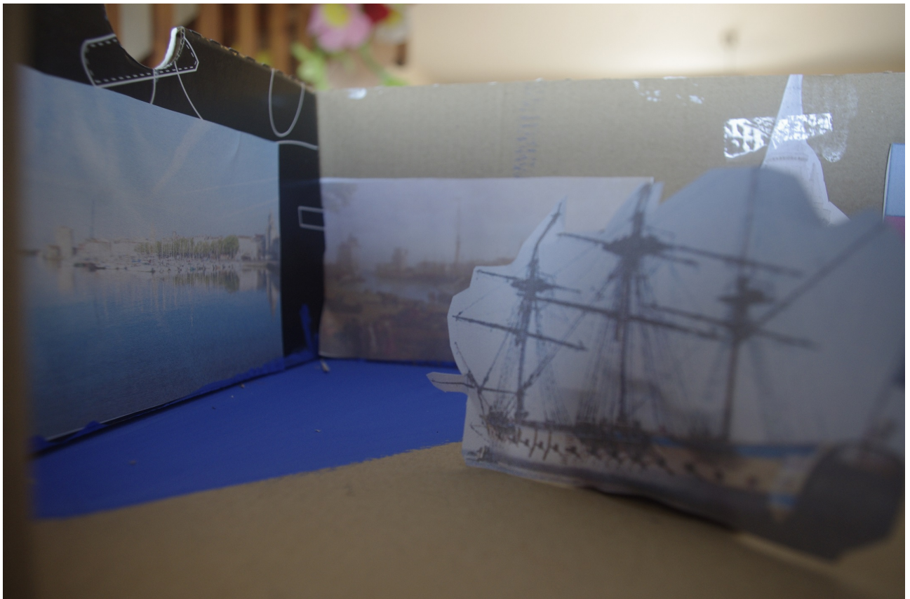
la Rochelle au Moyen-Age était une ville très commerciale