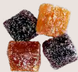
PÂTE DE FRUITS «MAISON» A la purée de fruits - 200 Gr