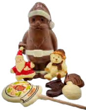
HOTTE DU PÈRE-NOËL, GARNIE DE: - un Père-Noël au chocolat au lait - 150 Gr de fritures de chocolat assorties - 2 sujets de Noël chocolat blanc - 1 sucette de Noël chocolat blanc