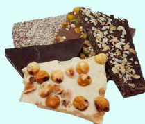
ASSORTIMENT DE MORCEAUX BRUTS DE TABLETTES À CASSER Chocolat noir, lait et blanc nature, noisettes, feuilletine, mendiants - 300 Gr