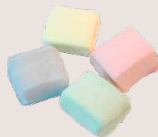
CUBES DE GUIMAUVE Aux saveurs d'antan : violette, citron, mandarine, anis, fleur d'orange - 80 Gr