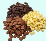
PISTOLES DE CHOCOLAT Chocolat noir 70% cacao, chocolat lait 33,6% cacao, ou chocolat blanc 28% cacao. Idéal pour réaliser vos desserts chocolatés ! - 500 Gr