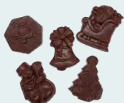
FRITURE DE CHOCOLAT NOIR SANS SUCRE AJOUTÉ 200 Gr

Ce chocolat noir est issu d'une recette spécifique où le sucre a été remplacé par le Maltitol, extrait de l'amidon de blé ou de maïs, qui reproduit le goût du sucre de façon presque identique. Il est donc diététique, à teneur en glucides réduite et convient également à tous ceux qui sont attentifs à leur consommation de sucre.