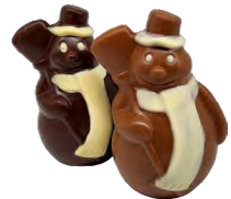
BONHOMME DE NEIGE EN CHOCOLAT Chocolat lait ou noir, garni de fritures - 80 Gr