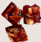
NOUGAT ROUGE AUX AMANDES Nougat croquant - 350 Gr