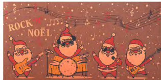
CARTE POSTALE EN CHOCOLAT Au décor de Noël - 120 Gr