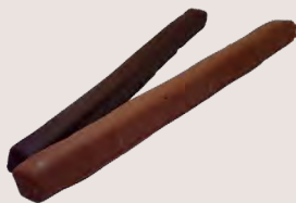
BÂTON DE GUIMAUVE ENROBÉ Chocolat noir ou lait - 60 Gr