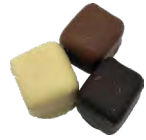
CUBES DE GUIMAUVE ENROBÉS Aux saveurs d'antan : anis, violette, citron, mandarine, fleur d'oranger. Au choix: chocolat noir, lait ou blanc, ou mélange - 200 Gr