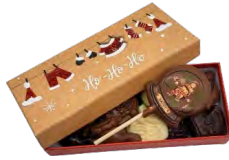
BOÎTE DE NOËL GARNIE DE FRITURES, ET UNE SUCETTE Chocolat noir, lait et blanc - 150 Gr