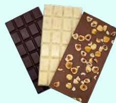
TABLETTES DE CHOCOLAT Chocolat noir, lait ou blanc nature ou agrémentées de noisettes, ou de feuilletine (brisure de crêpes) - à l'unité ou par lot de 3