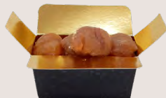
MARRONS GLACÉS Marrons d'Ardèche AOP - 100 Gr