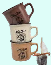
LE CHOCO'CHÔ Une tasse, un cube de chocolat noir à plonger dans du lait bien chaud et retrouvez le chocolat chaud d'antan !