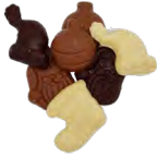
FRITURE AUX 3 CHOCOLATS 200 Gr