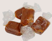
CARAMELS TENDRES A la fleur de sel de l'île de Ré - 200 Gr