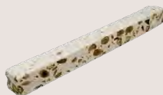
BARRE DE NOUGAT BLANC Nougat tendre maison au miel toutes fleurs, amandes , noisettes et pistaches - 100 Gr