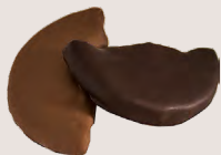
QUARTIERS D'ORANGE ENROBÉS Chocolat noir et lait - 200 Gr