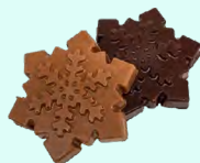
DUO DE FLOCON Chocolat noir et lait, à la feuilletine (brisure de crêpes bretonnes) - 70 Gr