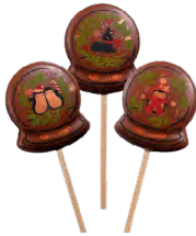
3 SUCETTES AU DÉCOR DE NOËL Au chocolat noir, lait et blanc