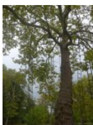
L'arbre aux échelles (François Méchain)