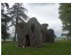
Installation (Patrick Dougherty)