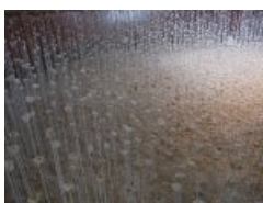
Le nid des murmures (Stéphane Guiran)

Ils ont également bénéficié d'une visite guidée du parc historique et des œuvres d'art contemporain qui y sont exposées (cliquez sur les images pour les grandir).