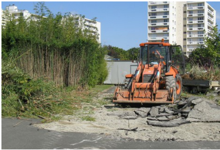
Un "tracto" dans le lycée

Les travaux ont débuté en septembre 2008 et doivent être terminés pour avril 2009.