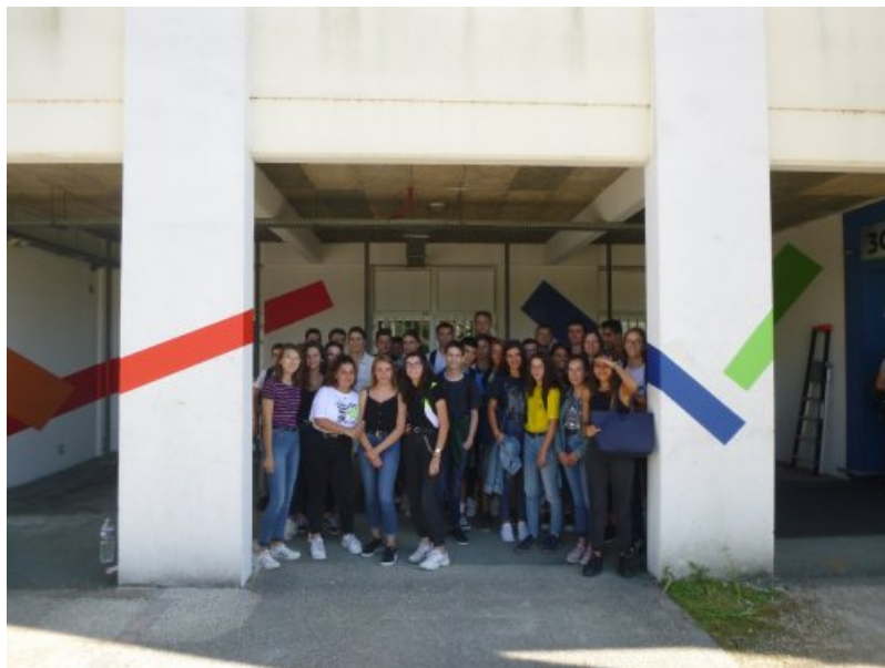
Photo collective de la classe avec l'artiste

Anamorphose : « Procédé mathématique qui s'apparente à une illusion d'optique. Il s'agit de transformer des images déformées en images « normales » si elles sont vues d'un point précis. L'effet est bluffant si le spectateur se situe au bon endroit. »