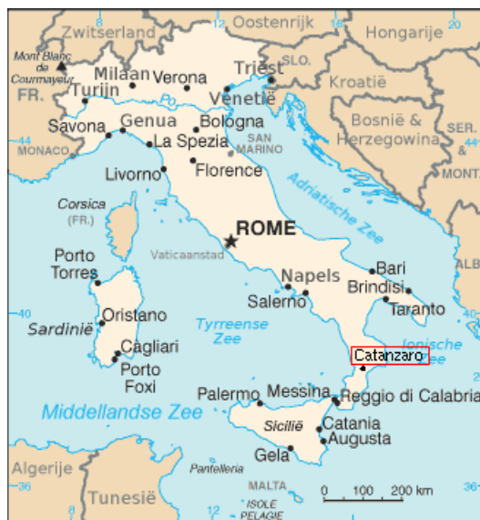
Catanzaro, au sud de l'Italie

Le Lycée de la Venise verte accueillera 18 élèves des pays partenaires en mars 2019 pour participer à la chorégraphie.