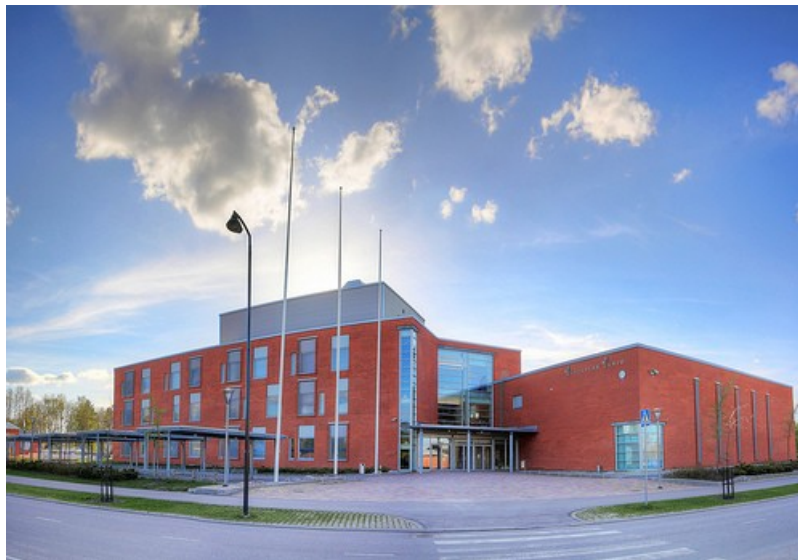
Lycée de Mäntsälä, en Finlande

Ces « lycéens reporters » mèneront une enquête sur les habitudes alimentaires de 4 pays d'Europe : Finlande, République Tchèque, Italie et France. Ils seront à l'affût de nouvelles expériences et de témoignages d'acteurs engagés pour défendre le bien être des citoyens. Ils intervieweront des spécialistes de la santé et concevront des supports de prévention.