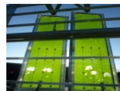
panneaux énergie avec des algues