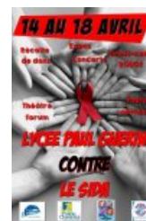
Affiche de la semaine contre le SIDA - 2014