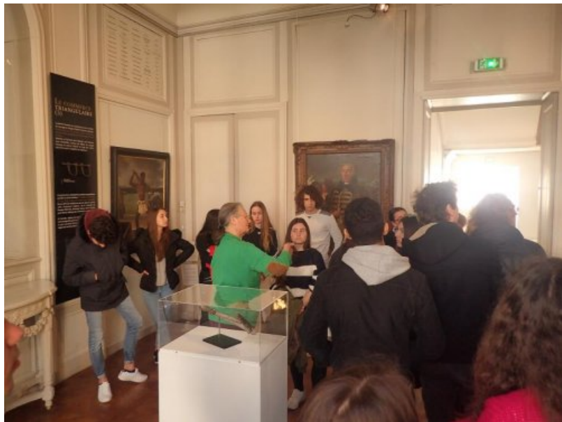
en passant par Rochefort avec la visite de l'Hermione.