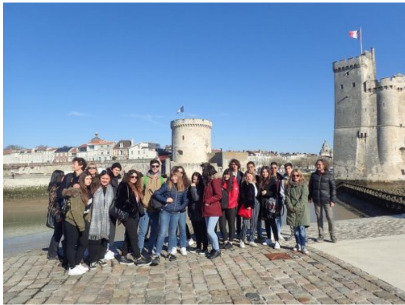
autour du Musée du Nouveau Monde