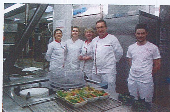
Une partie de l'équipe de la restauration

Tout à fait ! Nous avons des commentaires souvent élogieux, quelquefois moins, car nous ne sommes pas un restaurant d'entreprise et nous ne pouvons pas non plus fournir des steaks les jours de poisson, plan alimentaire oblige. Et puis notre cœur de métier et de public, ce sont les élèves. Lorsqu'il y a des animations, des repas à thème ou des actions de lutte contre le gaspillage alimentaire, nous suscitons la surprise des stagiaires.