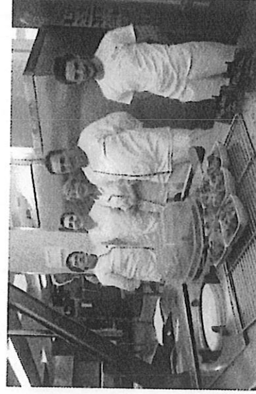
Une partie de l'équipe de la restauration

Tout à fait ! Nous avons des commentaires souvent élogieux, quelquefois moins, car nous ne sommes pas un restaurant d'entreprise et nous ne pouvons pas non plus fournir des steaks les jours de poisson, plan alimentaire oblige. Et puis notre cœur de métier et de public, ce sont les élèves. Lorsqu'il y a des animations, des repas à thème ou des actions de lutte contre le gaspillage alimentaire, nous suscitons la surprise des stagiaires.