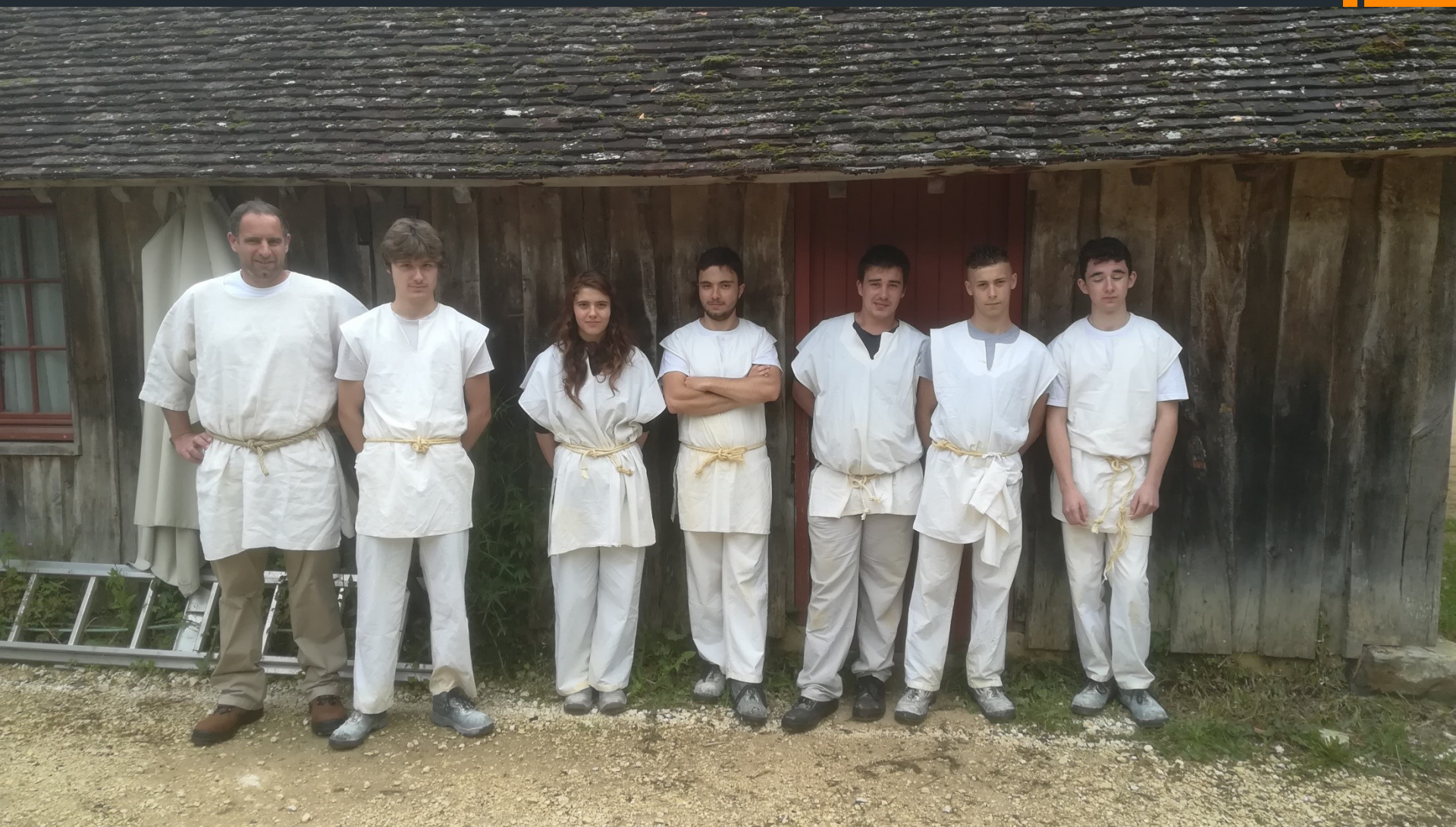
L'équipe des maçons