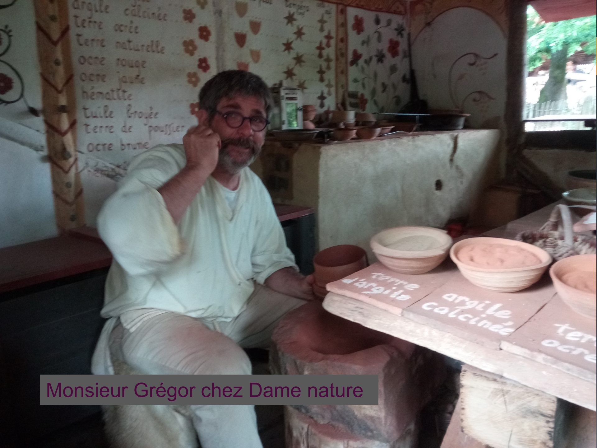
Monsieur Grégor chez Dame nature