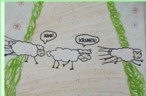
Rose-Emma (4°2) : une histoire de moutons...