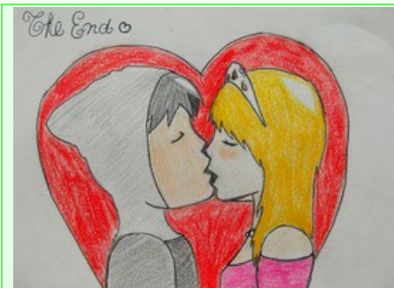
Zoé (4°1) vous présente "C'est beau l'amour !"