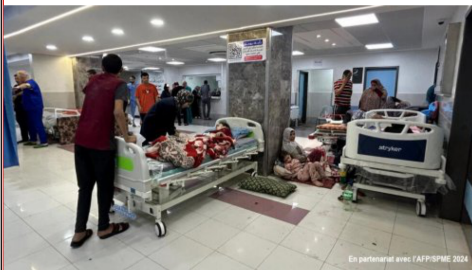
En partenariat avec l'AFP/SPME 2024