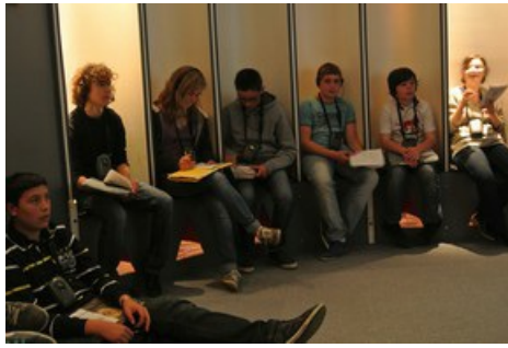
Les élèves ont travaillé lors de cette journée : la preuve par l'image :