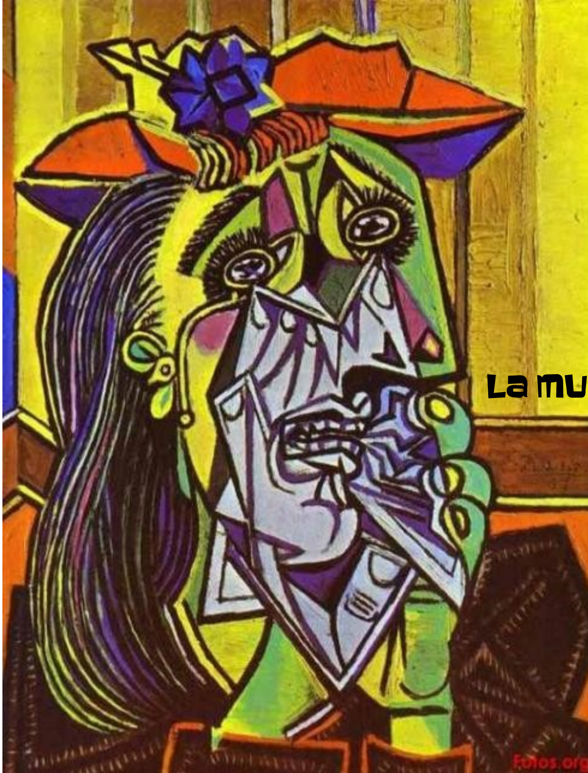
La MUJER QUE LLORA