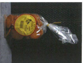
SABLÉ DU POITOU À LA CANNELLE 150 g PUR BEURRE PRIX : 2,50 € REF : 502 014