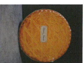
BROYÉ 360 g PUR BEURRE PRIX : 4,00 € REF : 540 023