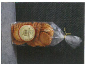
SABLÉ 300 g PUR BEURRE PRIX : 4,00 € REF : 502 700