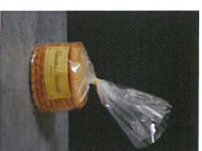
PETITS BROYÉS 250 g PUR BEURRE PRIX : 3,00 € REF : 540 016