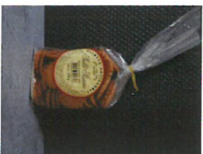
SABLÉ SÉSAME 150 g PUR BEURRE PRIX : 2,50 € REF : 502 717