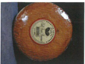
SABLÉ FOURRÉ AUX PRUNEAUX 400 g PUR BEURRE PRIX : 5,50 € REF : 502 007