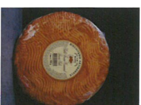
SABLÉ CARAMEL 380 g PUR BEURRE PRIX : 5,50 € REF : 502 045