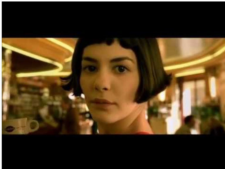
MÉTRO-Amélie - extrait du film "Le fabuleux destin d'Amélie poulain".

Le Fabuleux Destin d'Amélie Poulain est un film français réalisé par Jean-Pierre Jeunet et sorti en 2001. Il s'agit d'une comédie romantique écrite par Jean-Pierre Jeunet et Guillaume Laurant avec Audrey Tautou dans le rôle titre.