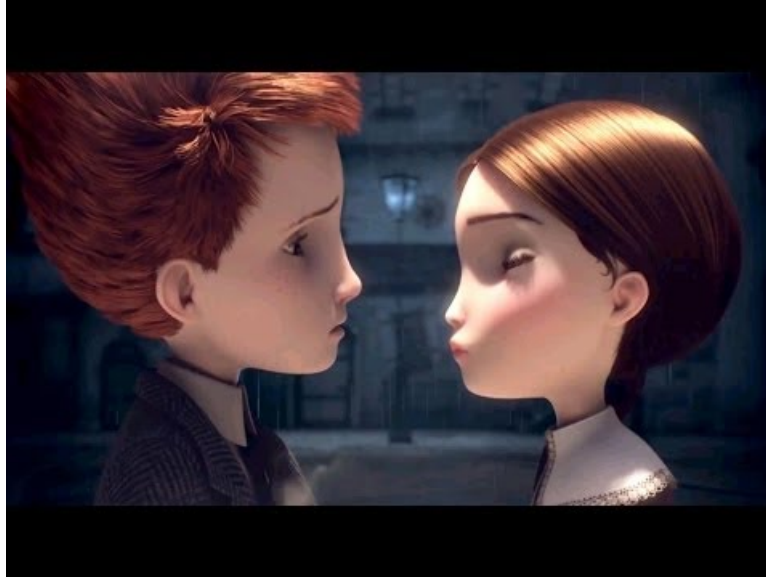
JACK ET LA MECANIQUE DU COEUR "Rencontre en Chanson" Extrait # 1 (Video Youtube)

Jack et la mécanique du coeur 2014 par Stéphane Berla et Mathias Malzieu. Mathias Malzieu, le chanteur du groupe Dionysos, transpose Jack et la mécanique du coeur , son joli conte gothique, sur grand écran dans un univers fascinant