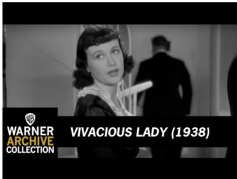
Vivacious Lady (Preview Clip)

Le Fabuleux Destin d'Amélie Poulain est un film français réalisé par Jean-Pierre Jeunet et sorti en 2001. Il s'agit d'une comédie romantique écrite par Jean-Pierre Jeunet et Guillaume Laurant avec Audrey Tautou dans le rôle titre.