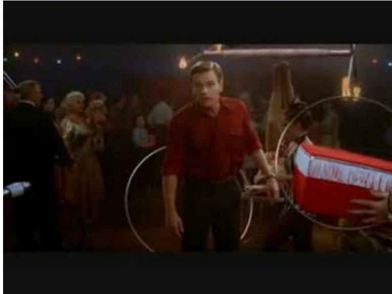
Big Fish - Le Coup de Foudre (le temps) (Video Youtube)

Big Fish ou Big Fish : La Légende du gros poisson au Québec, est un film fantastique américain de Tim Burton, écrit par John August et sorti en 2003.