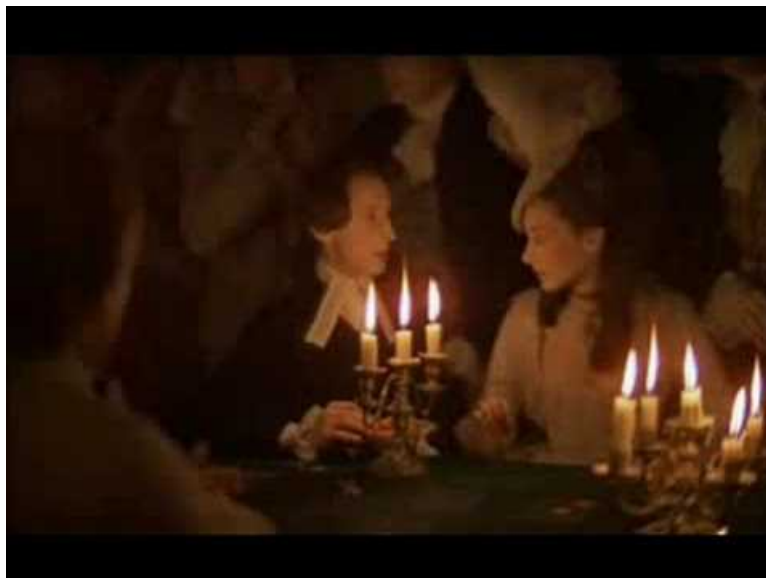
Barry Lyndon - Seduction Scene (Video Youtube)

Barry Lyndon , de Stanley Kubrick (1975) Dans cette scène du classique de Stanley Kubrick, pas un mot n'est échangé. Tout passe dans le regard de cette femme et cet homme qui se désirent... Un moment suspendu, porté par la musique... jusqu'au baiser.