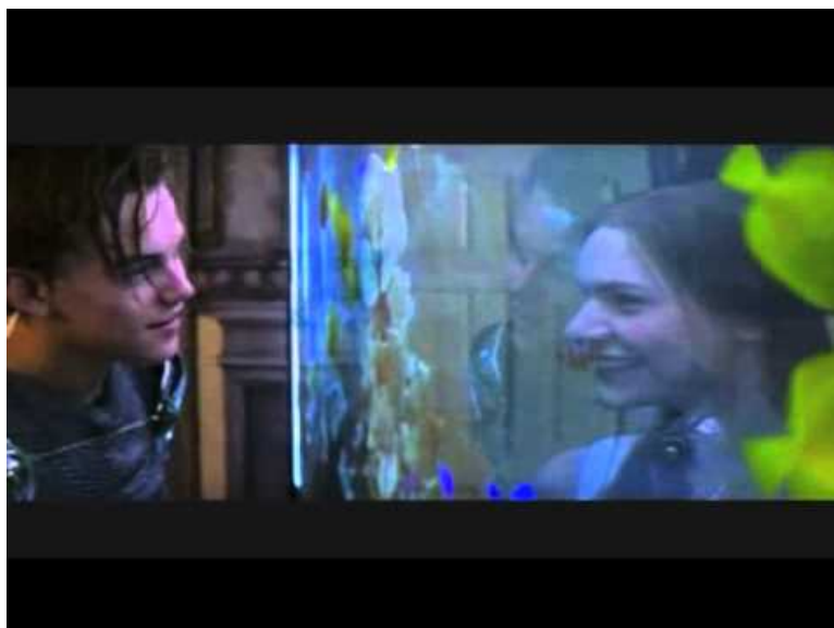
Romeo and Juliet, Fish Tank Scene ( Video Youtube )

Roméo + Juliette de William Shakespeare est un film américain réalisé par Baz Luhrmann en 1996.