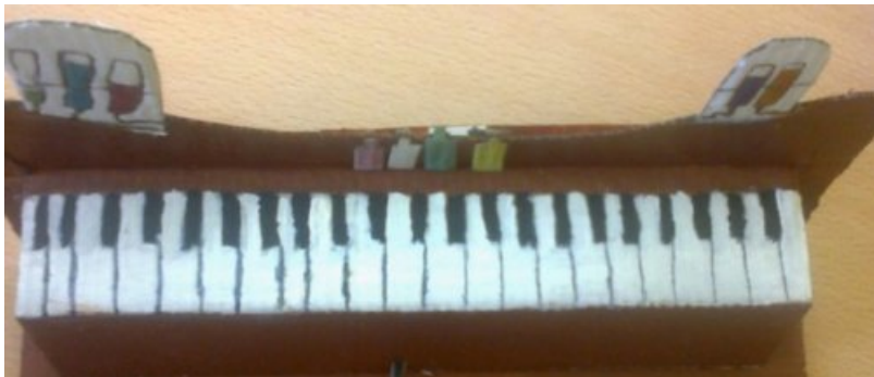
dans le film :