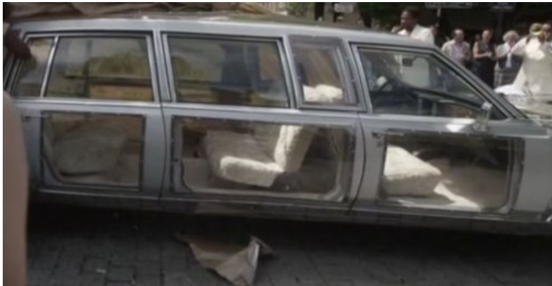
Le "piano cocktail" de Colin par