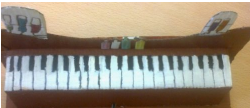
dans le film :