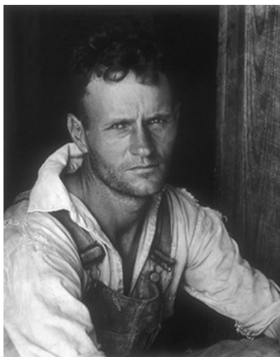
Alabama Tenant Farmer, 1936