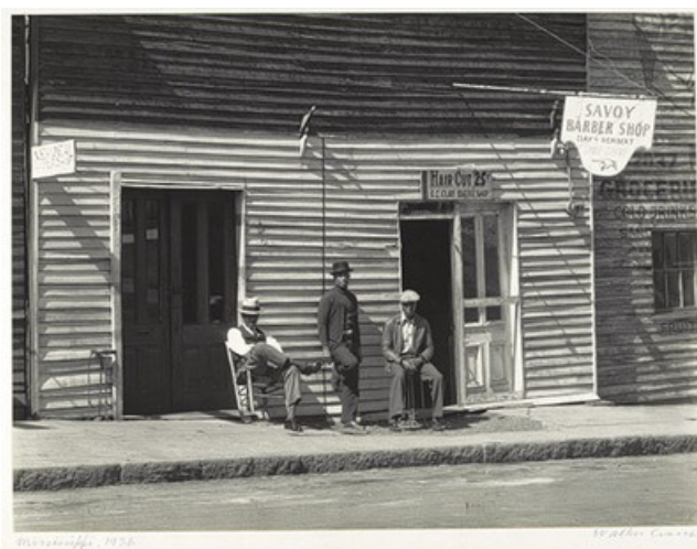
Street Scene, Vicksburg, Mississippi, 1936