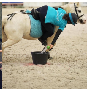
Le pony games