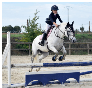
Le saut d'obstacles

https://www.ffe.com/pratiquer/les-bienfaits-de-l-equitation