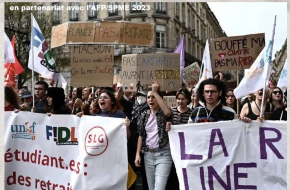
Students are demonstrating against the reform of pension system in Bordeaux.