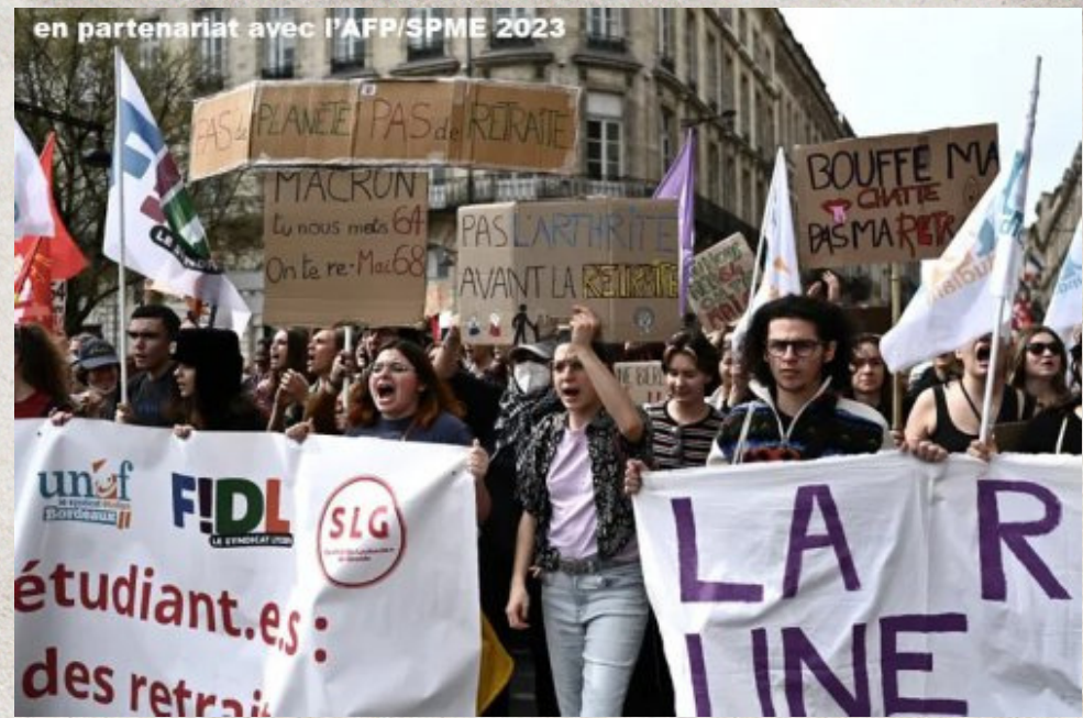
Des étudiants manifestent contre la réforme des retraites à Bordeaux

Cela n'a fait qu'accentuer le mécontentement des Français. Alors que le gouvernement affirme sa volonté "d'apaisement", les violences entre policiers et manifestants sont de plus en plus nombreuses et inquiètent.