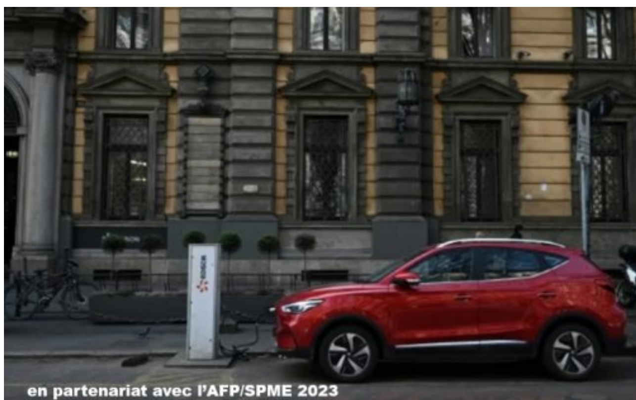
en partenariat avec l'AFP/SPME 2023

This Monday 27th March, the European Union decided to stop the use of gasoline-powered cars starting in 2035. They have not followed up on the German's proposition to use syntetics fuels. continued p.3