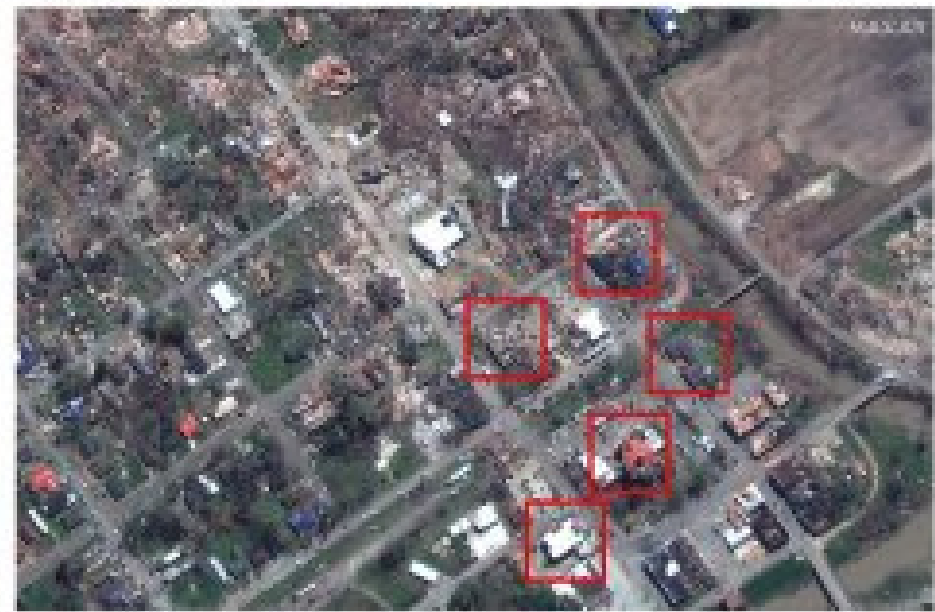
Satellite image ©2023 Maxar Technologies Données cartes : US Census Bureau