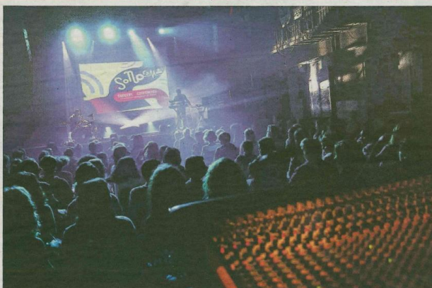
Les ados ont appris que leurs oreilles avaient besoin de repos. Et qu'en cas de perception d'acouphènes, il leur fallait vite alerter un médecin.