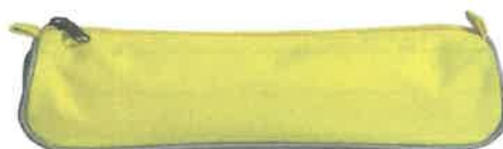
Trousse coloris aléatoire