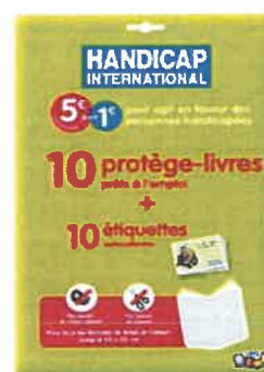
Kit de 10 protège-livre