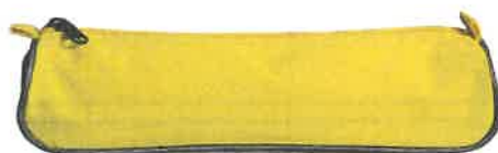
Trousse coloris aléatoire