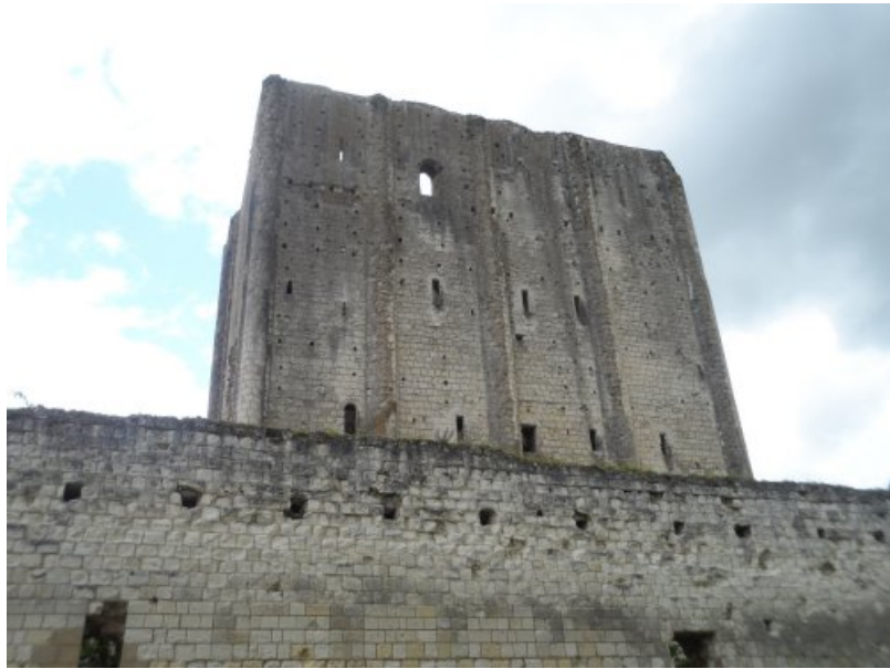
5) donjon de Loches