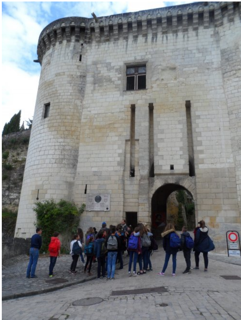
6) logis royal de Loches