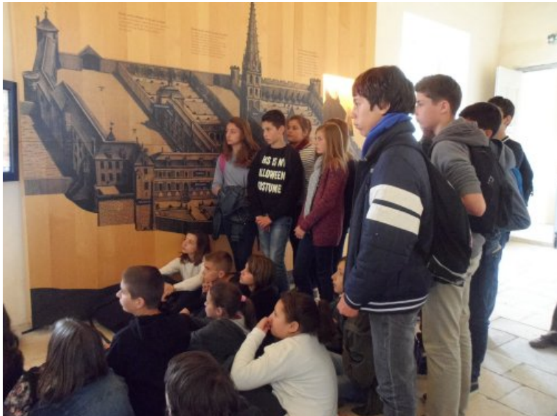
4) rempart de Loches