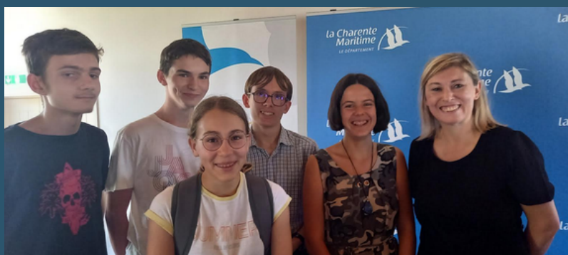
Remise des prix Brouage 14 juin 2022 avec 5 élèves du collège