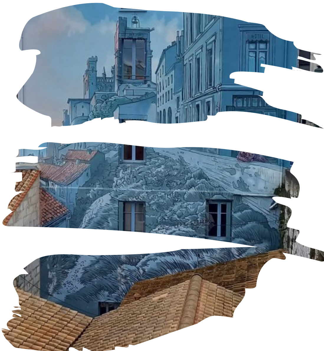
sortie Angoulême décembre 2021 - photo d'une fresque dans la ville

Sorties aux thermes de Chassenon et au FRAC d'Angoulême quelques exemples de sorties scolaires de l'année