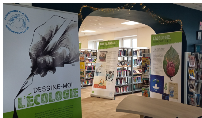
CDI collège René Caillié expo cartooning for Peace