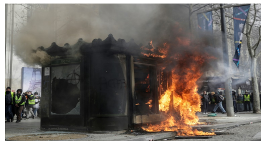
Kiosque à journaux en flammes sur l'avenue des Champs-Élysées lors de la manifestation des "gilets jaunes" le 16 mars à Paris

Un cargo italien, «Grande America», a sombré au large de la Rochelle provoquant une marée noire. Une nappe d'hydrocarbures et du fioul risquent de passer un séjour sur les côtes françaises. Pages 12/13