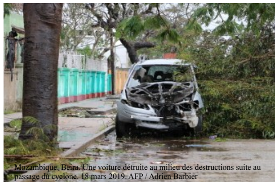
Mozambique, Beira. Une voiture détruite au milieu des destructions suite au passage du cyclone. 18 mars 2019.