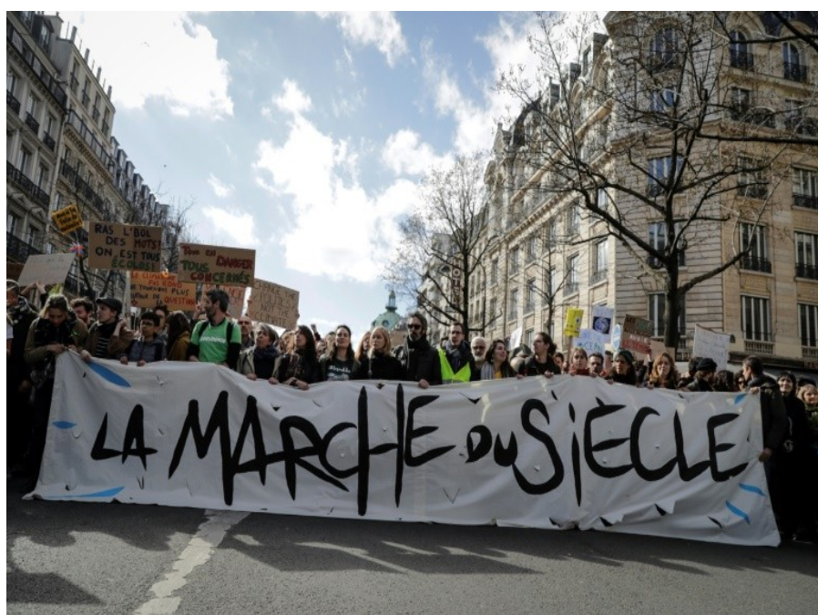
Des manifestants défilent pour le climat et la diversité lors de "la marche du siècle" le 16 mars 2019 à Paris

La génération future du monde entier s'inquiète pour sa planète. En effet, les jeunes luttent tous ensemble contre l'inaction des gouvernements mondiaux face au réchauffement climatique et à la pollution. Page 2