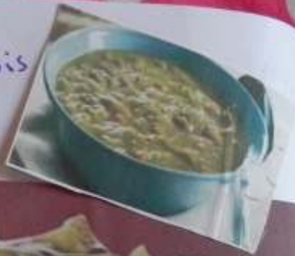
SOUPE aux pois