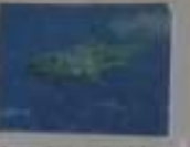
Grand requin blanc