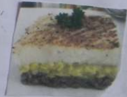
le pâté chinois