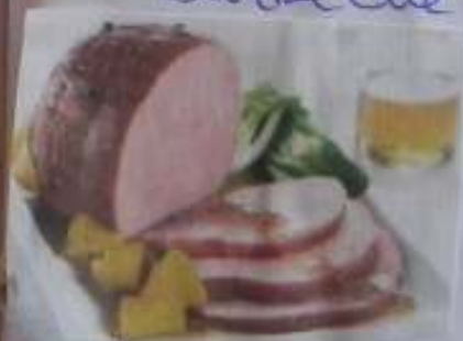
le Jambon aux sirop d'érable

Durant mes longues excursions, j'ai mangé chaque jour un plat différent comme le ragoût pattes de cochon, la soupe aux pois, le pâté chinois la Poutine, la tourtière et le Jambon aux sirop d'érable. La Poutine est constitué de frites et de morceaux de fromages CHEDDAR frais recouvert d'une sauce chaude de type barbecue marron. Suculents!