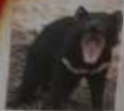
Diablot de Tasmanie