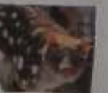
oursinial à queue tachetée