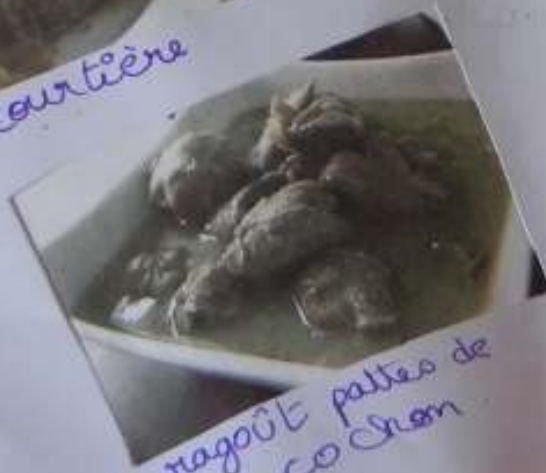
ragout pattes de cochon

Durant mes longues excursions, j'ai mangé chaque jour un plat différent comme le ragoût pattes de cochon, la soupe aux pois, le pâté chinois la Poutine, la tourtière et le Jambon aux sirop d'érable. La Poutine est constitué de frites et de morceaux de fromages CHEDDAR frais recouvert d'une sauce chaude de type barbecue marron. Suculents!