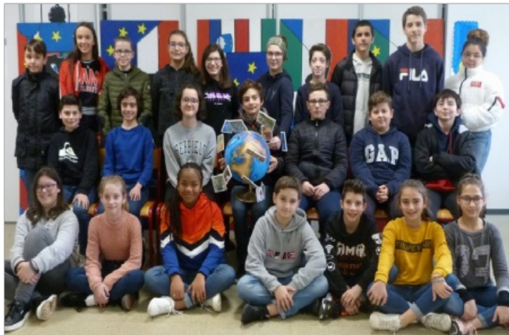
La classe de 5eA