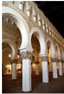
Synagogue Santa Maria la blanca