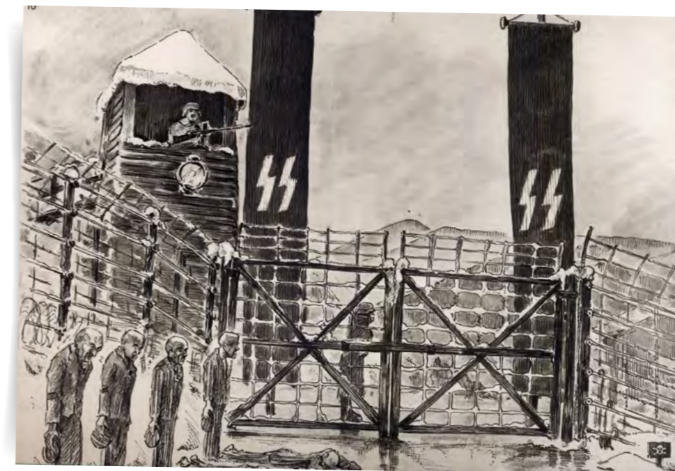
Le piquet, punition individuelle, Natzweiler. Dessin d'Henri Gayot.