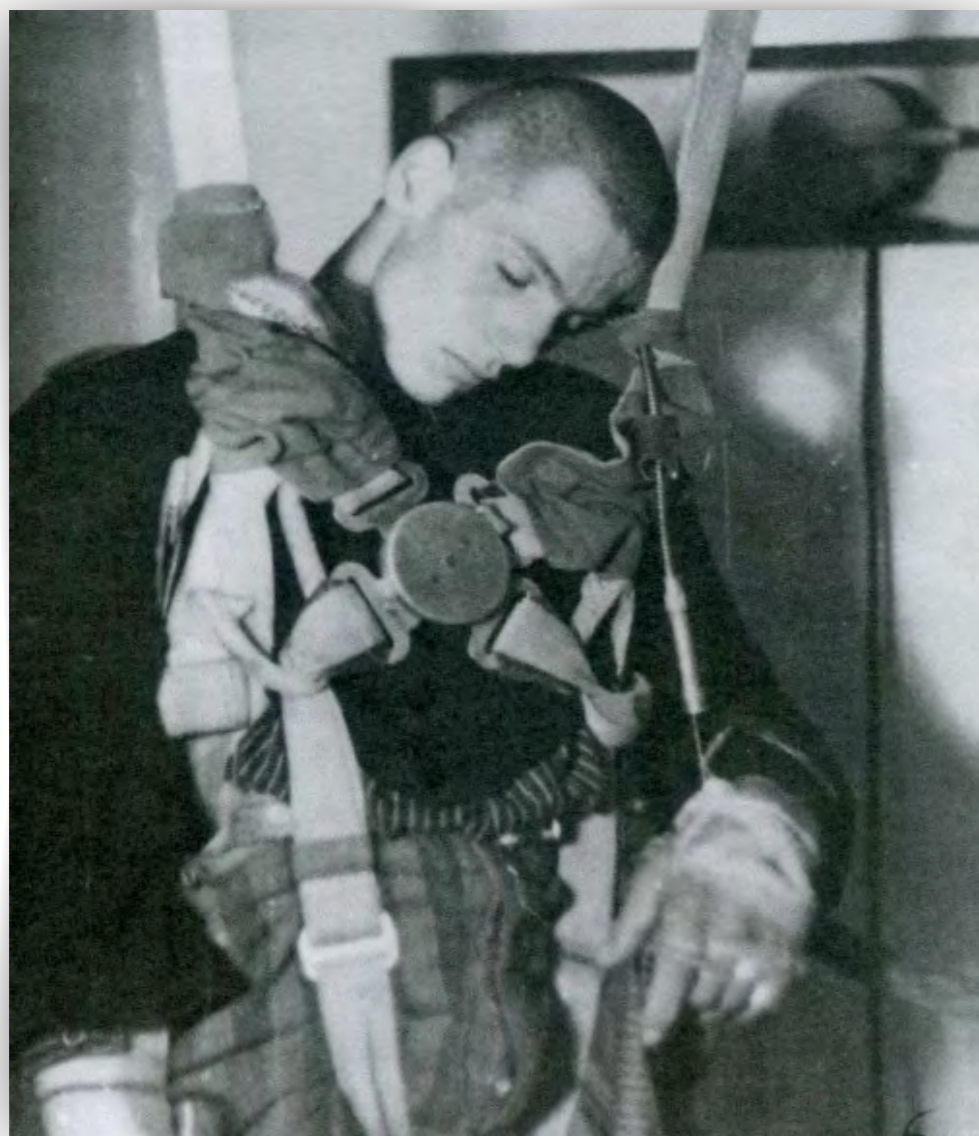
Expérience concernant la résistance du corps humain soumis aux basses pressions, menée sur un détenu à Dachau en 1942.

Aussitôt achevé le procès des grands criminels de guerre, c'est dans les mêmes lieux que la juridiction américaine entreprend de juger d'autres accusés, regroupés par professions ou fonctions : hommes politiques, industriels, médecins. Douze procès succèdent ainsi à celui des grands criminels de guerre. Le premier est celui des médecins, administrateurs et personnels des différents services de santé et de recherche allemands, impliqués dans les expérimentations médicales pratiquées sur les détenus dans les camps de concentration, comme les inoculations de virus ou d'agents bactériens, tests d'endurance au froid ou aux variations brutales de pression, stérilisations d'hommes, de femmes et d'enfants, prélèvements d'organes à des fins d'études en laboratoires d'anatomie, etc. Du 15 novembre 1946 au 21 août 1947, vingt-trois médecins nazis comparaissent devant un Tribunal militaire américain, dont la compétence et la mission relèvent de la Loi n° 10 du Conseil de contrôle de l'Allemagne. À travers ce procès, c'est le principe des expérimentations médicales criminelles qui est jugé. En effet, la révélation de pseudo-expériences scientifiques pratiquées sur des déportés et de l'implication de nombreux médecins a profondément choqué l'opinion publique. Au moment de rédiger son jugement, le tribunal éprouve donc le besoin de rassembler et de formaliser des principes éthiques jusqu'ici épars, dans un prologue connu sous la dénomination de code de Nuremberg.