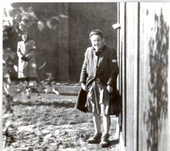
Photographie de la jambe d'une des victimes des expériences pseudo-médicales du SS Professeur Gebhardt prise clandestinement par les Polonaises en septembre 1944. Au fond à gauche, une détenue fait le guet.