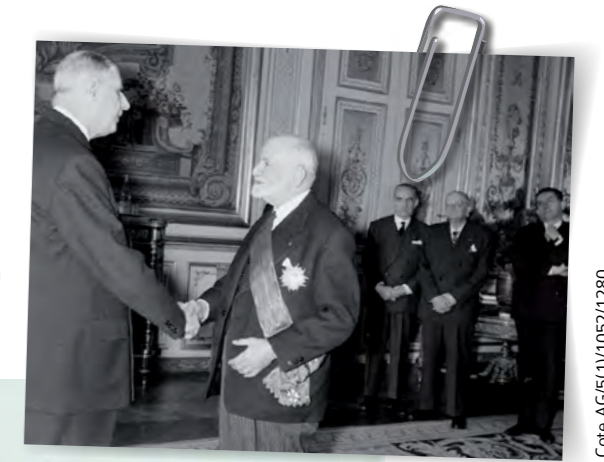
René Cassin et le général de Gaulle.