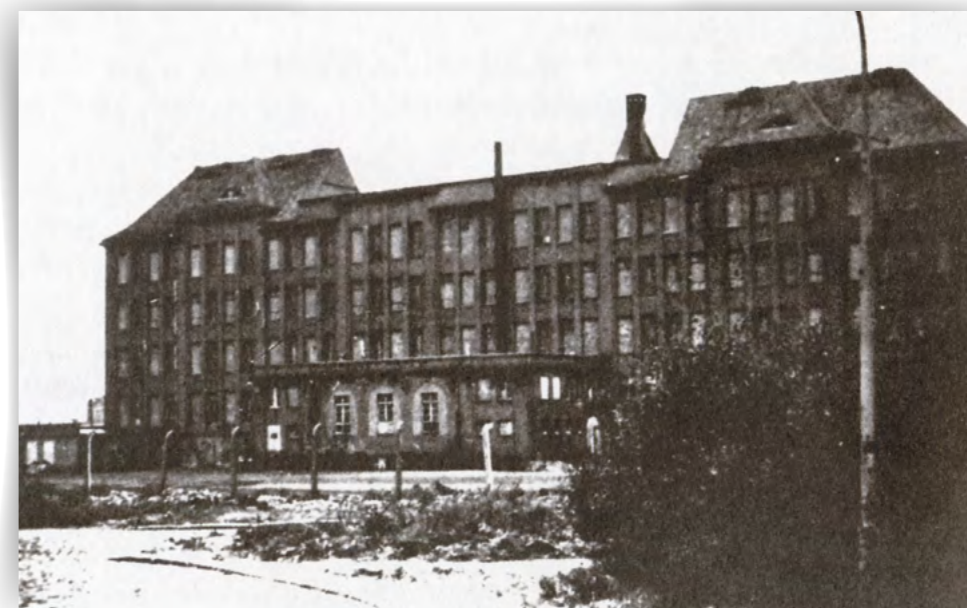
L'école de Bullenhusen Damm, à Hambourg, en 1945.