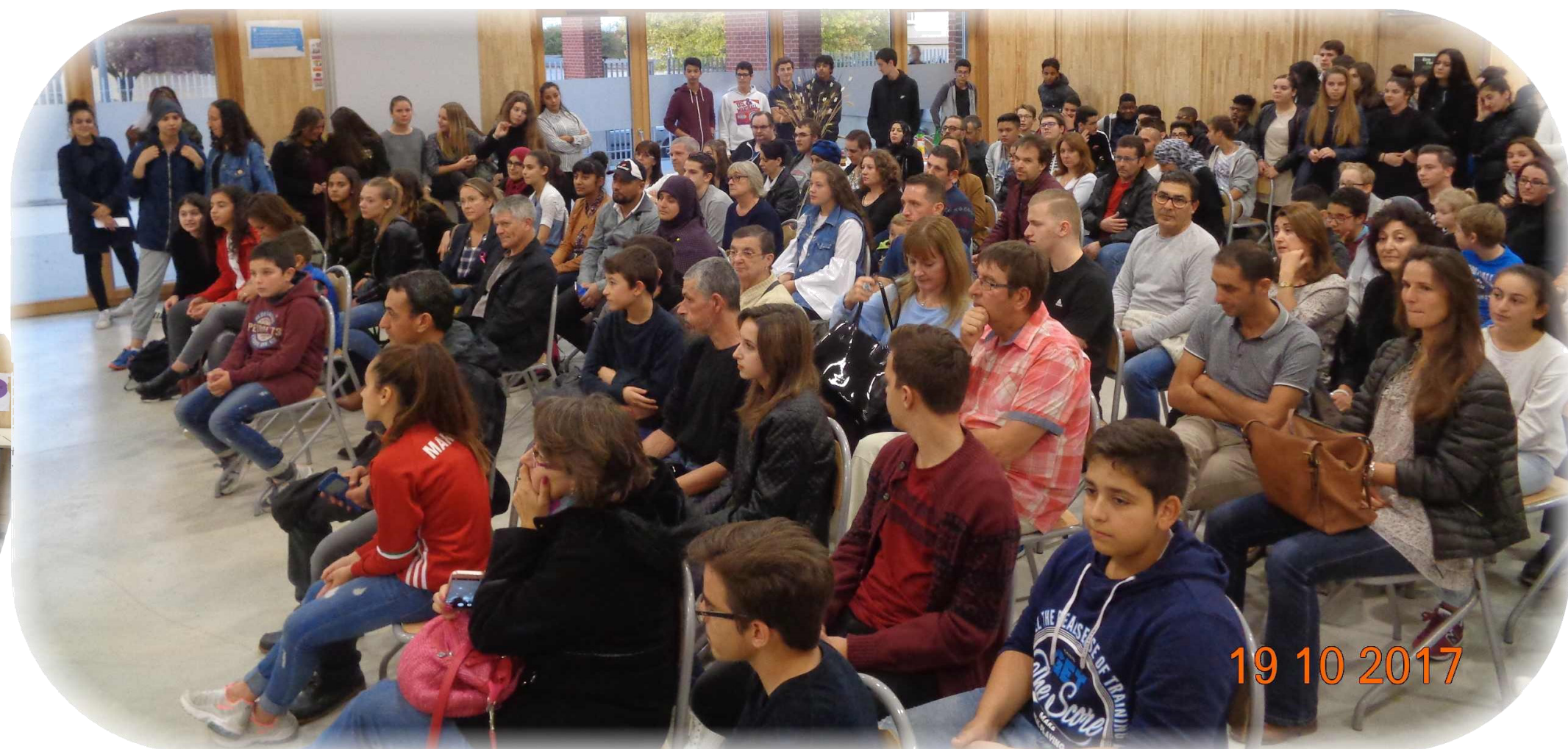
Les lauréats, accompagnés de leurs parents, sont venus très nombreux à la remise des diplômes du DELF et du DNB session 2017