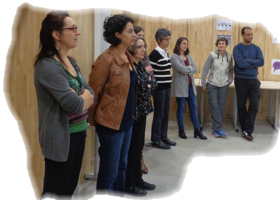
Moment de partage entre familles et les personnels du collège

Le principal accueille les familles et ouvre la cérémonie remise des diplômes du DELF et du Brevet par un discours en l'honneur des 89 lauréats de la session 2017.