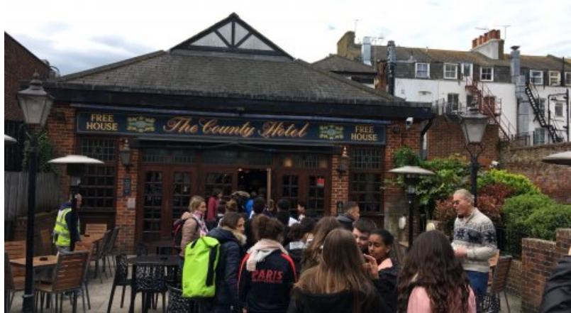
Sortie du train... Good bye la France !