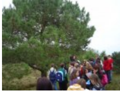
En arrière plan, un pin maritime...