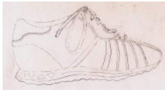
Dessin d'Estelle Michaud.