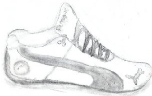
Fusain de Jennifer Quéré

4) Regard sur les productions. Les élèves essaient d'exprimer la spécificité de chaque outil, les difficultés rencontrées. Explication et prise de note pour le vocabulaire. Références.