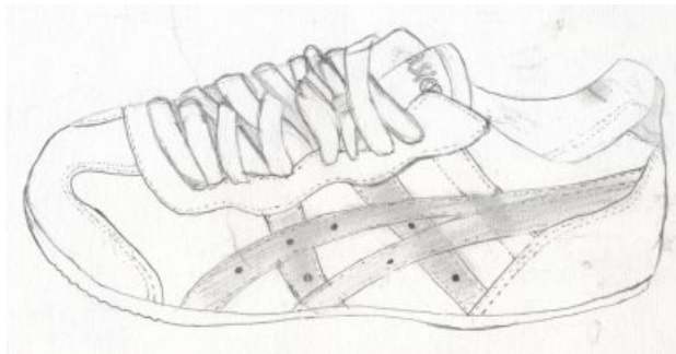
Dessin de Sanh Nguyen

2) Dessin à l'encre : le cerne et l'aplat (lavis).