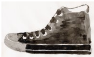
Lavis de Gaïa Berthommé.

Consigne n° 2 = « Laissez-vous en-traînée par votre pinceau ».