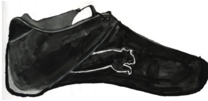
Lavis d'Elodie Monteil