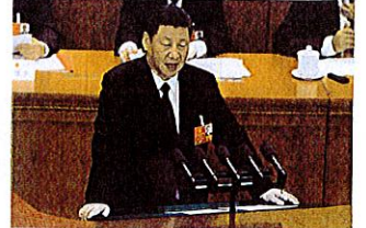
Président Xi Jinping face aux députés de l'Assemblée nationale populaire

Xi Jinping semble avoir été élu à vie, confond-il royauté, nationalisme et dictature ?