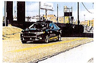
Prototype de véhicule autonome UBER à PITTSBURGH

Lundi 19 mars, aux États-Unis un Uber fauche la vie d'une jeune femme. Les voitures autonomes intelligentes sont-elles si intelligentes que ça ?