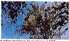
Un arbre magique, le guaimaro