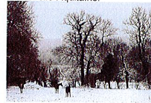
Neige, verglas, fin de la vigilance orange dans le Sud-Ouest

Une vague de froid va s'abattre sur la Nouvelle-Aquitaine.