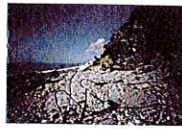
Au Havre, une ancienne décharge largue ses déchets à la mer