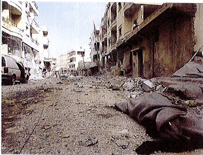
Raid aérien à Arbine

Un raid aérien fait exploser 15 enfants et 2 femmes réfugiés dans une école en Syrie.