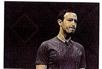
Nouveaux déboires pour Facebook

Facebook cité dans un scandale après avoir utilisé les données des utilisateurs.