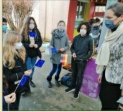
La rectrice a été accueillie par les élèves du collège de Soyaux.

L e collège Pierre-Mendès France de Soyaux recevait du beau monde hier après-midi à l'occasion de la journée franco-allemande. Véréna Von Roedern, la consule générale d'Allemagne, et Bénédicte Robert, la rectrice d'académie sont venues célébrer avec les germanistes de l'établissement, la signature du traité de l'Élysée en 1963 qui instaurait coopération et alliance entre la France et l'Allemagne. Un traité qui prévoyait aussi la promotion des langues des deux pays. «À travers une langue, c'est la vie qui est transformée. Ce sont de multiples possibilités qui se présentent à vous. Cependant, la France doit encore progresser dans l'apprentissage des langues étrangères» , a souligné Bénédicte Robert.