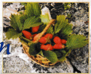
Un joli panier à fraises Dim. réelles : long. 0,18 m - larg. 0,12 m haut. sans anse : 0,07 m Les paniers utilisés pour les expéditions étaient d'un modèle différent, mais avaient les mêmes dimensions.

Ces petites fraises de bois, cultivées dans le marais distant de plus d'un kilomètre du village, étaient cueillies de très bon matin par les femmes. Détachées de leur pédoncule, elles étaient mises dans de petits paniers d'osier très fin, dans le fond desquels, pour maintenir une certaine fraîcheur, on avait préalablement placé une feuille de chou. Cette cueillette délicate était extrêmement pénible. Les paniers étaient placés en 2 rangs de 5 dans des cageots à étage. Les femmes revenaient au village chargées de 5 kg de fraises à chaque bras.