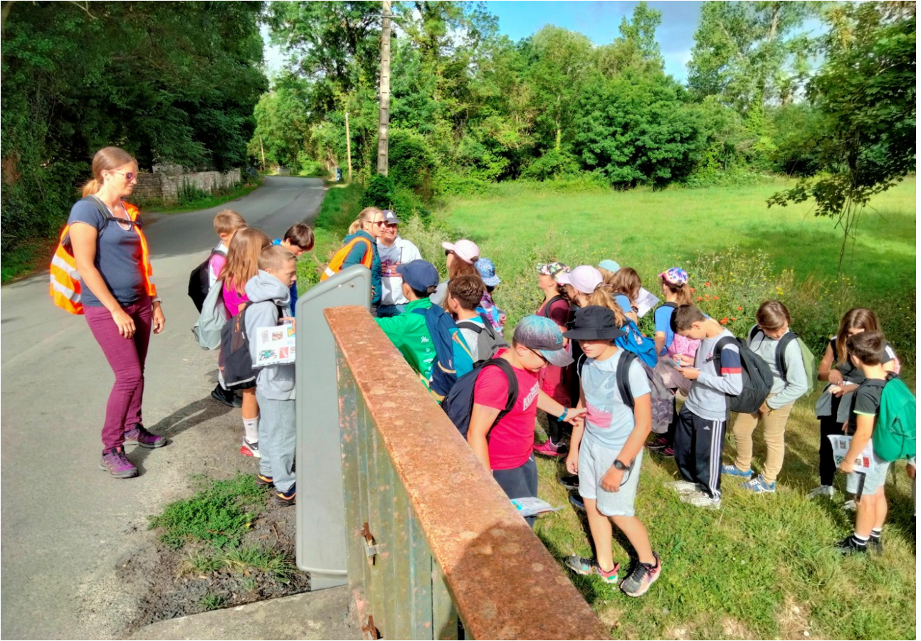
L'usine de méthanisation