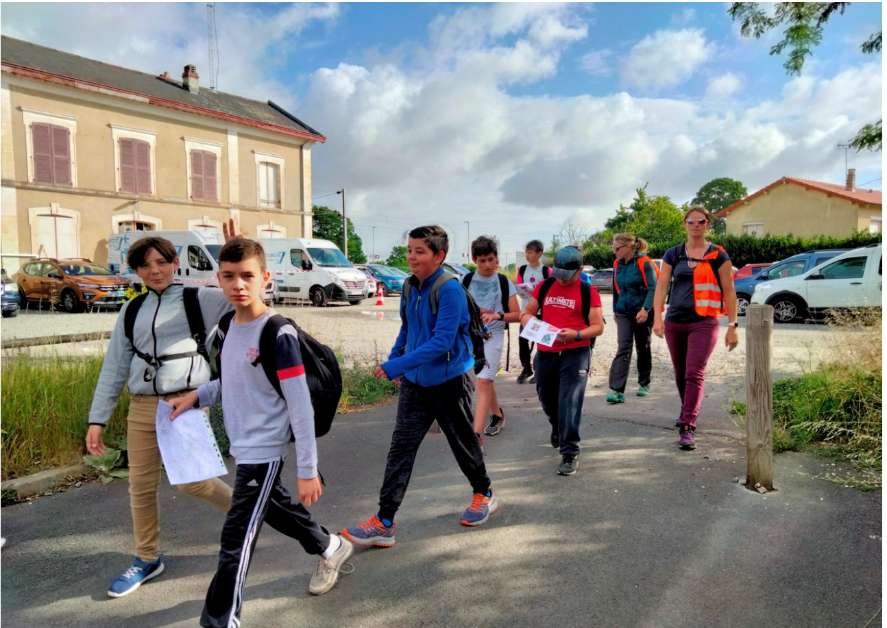
Le port de Mauzé